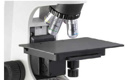
Platina y objetivos